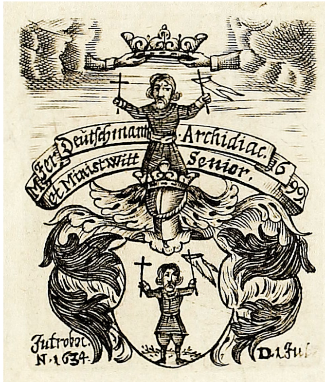
Ex libris des Jeremias Deutschmann (1634–1704).

DONNERSTAG, 14. MÄRZ 2024, LEUCOREA, BIBLIOTHEKSZIMMER