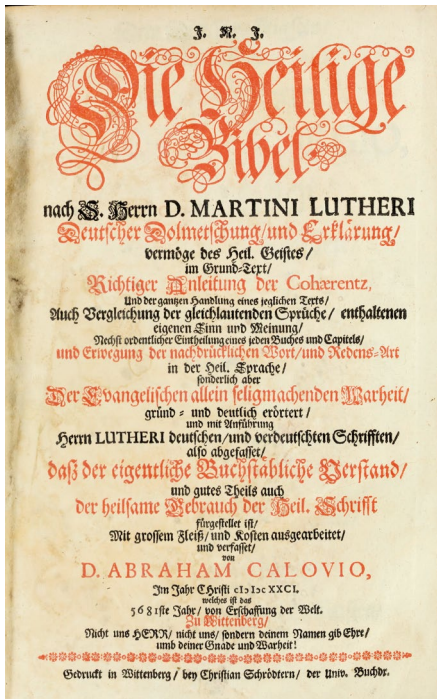
Titelblatt des ersten Bandes der sogen. „Calov-Bibel“, Wittenberg 1681 (RFB PS Eth 261/1).

FREITAG, 15. MÄRZ 2024, LEUCOREA, BIBLIOTHEKSZIMMER