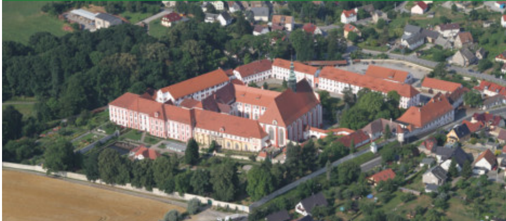
Außenaufnahme des Zisterzienserinnenklosters St. Marienstern