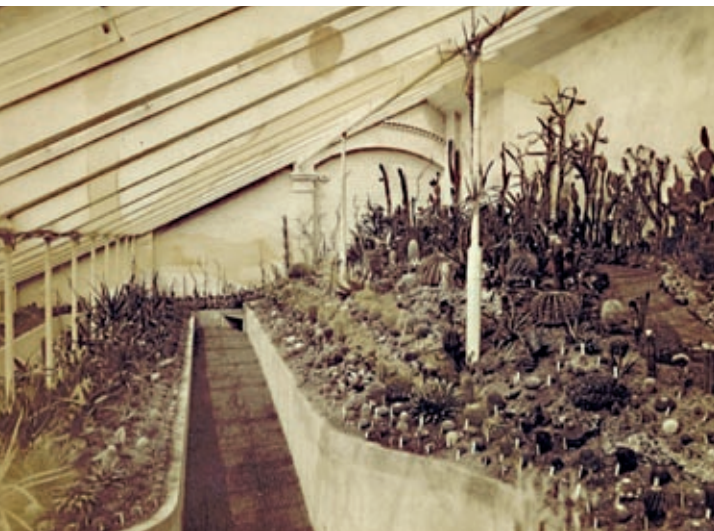
Hermann Grusons Kakteensammlung vor 1895.

Die Tagung zum 201. Geburtstag des Magdeburger Ehrenbürgers richtet sich an alle, die sich für Industrie- und Stadtgeschichte sowie speziell für die verschiedenen Facetten der Persönlichkeit Hermann Grusons interessieren.